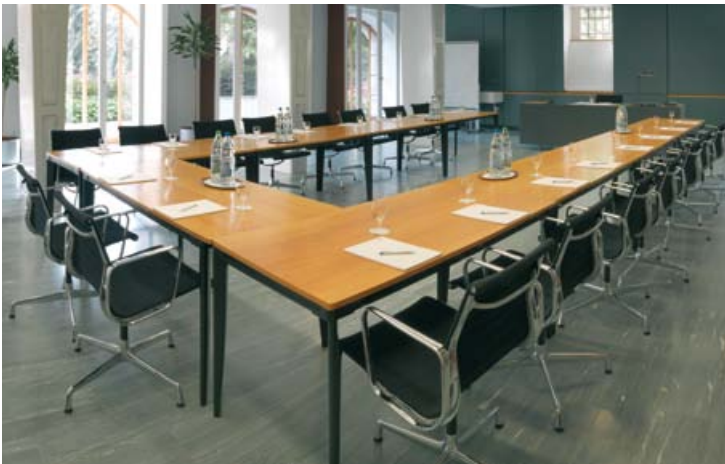
1 Seminarraum Limmat

DIE VILLA BOVERI MIT SITZUNGS- UND SEMINARRÄUMEN, RESTAURANT, GARTENSAAL UND TERRASSE SOWIE EINEM GROSSEN PARK BIETET IDEALE VORAUSSETZUNGEN FÜR DAS GELINGEN IHRER VERANSTALTUNG. ZEITGEMÄSSE TECHNIK, AUFMERKSAMER SERVICE UND EINE EFFIZIENTE ABWICKLUNG MIT TRANSPARENTE KOSTEN SIND SELBSTVERSTÄNDLICH.