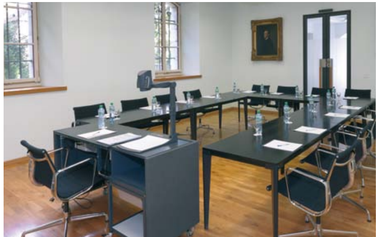
2 Seminarraum Jura